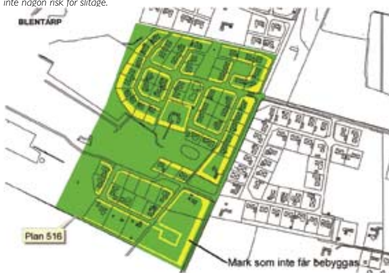
En av möjligheterna med att arbeta med digitala planer. En analog detaljplan innehåller som regel väldigt mycket information och kan därför ibland bli svårsläst. Hos den digitala planen kan handläggaren själv bestämma vilken information som ska visas för tillfälle. Som i detta exempel visas bara "mark som inte får bebyggas".