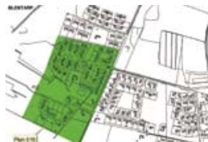
Det är möjligt att program lägga scannad vektoriserad detaljplan digital primärkart

Informationsutbyte är inte den minsta biten i vårt arbete. Ständig kartväxling mellan Sjöbo och andra kommuner samt Länsstyrelsen och Lantmäteriet kommer att underlättas betydligt med digital karthantering då våra partners oftast arbetar digitalt.