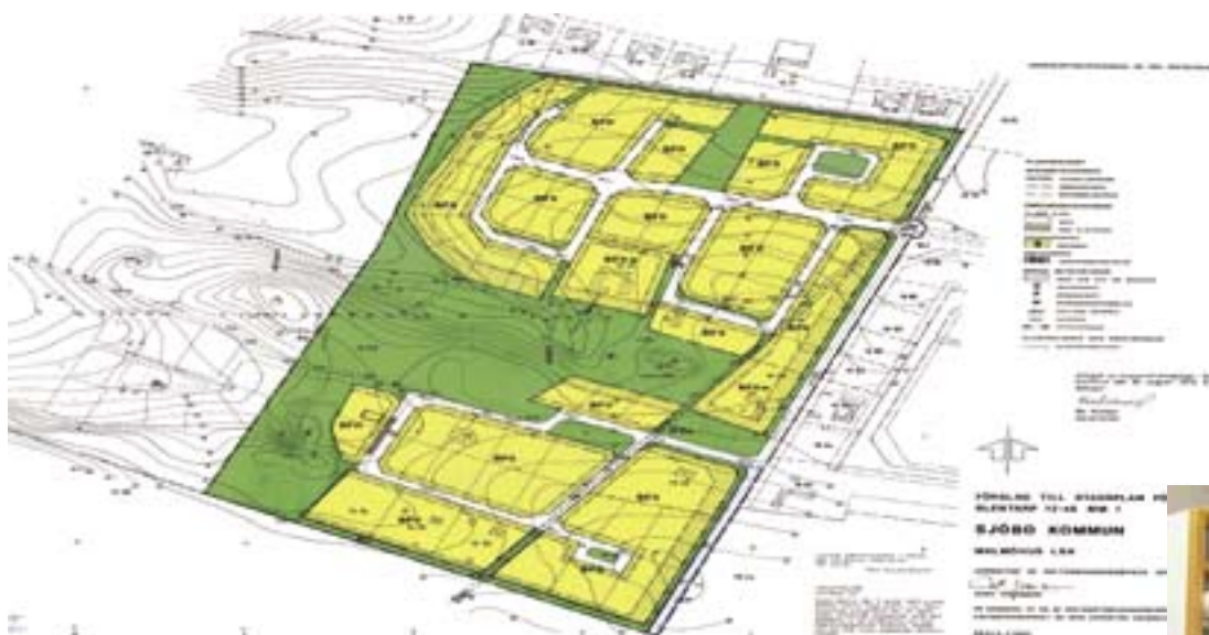
En scannad plan. Den grafiska skillnaden d v s färgåtergivningen mellan den analoga planen och dess digitala kopia är marginell, men den digitala planen kan göras åtkomlig på ett helt annat sätt, dessutom finns det inte någon risk för slitage.